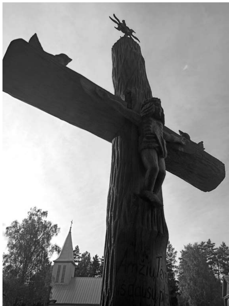
Paminklas išnykusiems kaimams Inkūnų bažnyčios šventoriuje.

2020 metais įregistruoti 63 (2019 metais - 59) santuokos nutraukimo įrašai. Trumpiausiai, iki vienerių metų, santuokoje gyveno 4 poros, nuo 2 iki 6 metų - 15, nuo 6 iki 20 - 29 ir daugiau nei 20 metų - 15 porų. Po santuokos nutraukimo 13