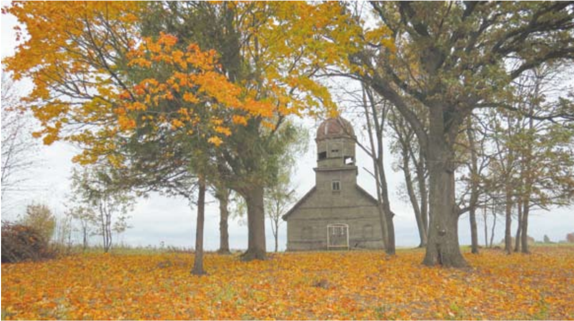
Girelės cerkvė nuo 2015 m. yra Lietuvos sentikių religinės bendruomenės nuosavybė. Šiomet cerkvė laukia naujų, jau užsakytų ir gaminamų langų bei durų.