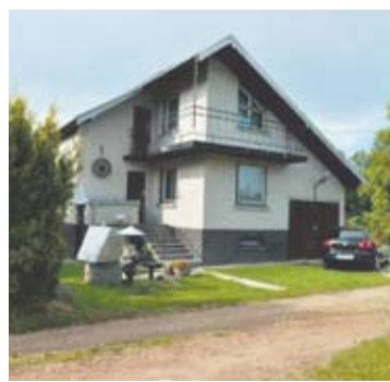
Negyvas naujagimis buvo aptiktas šios sodybos išvietės duobėje.

Panevėžio apygardos prokuratūroje baigtas ikiteisminis tyrimas dėl naujagimio nužudymo. Kaltinimai dėl mažamečio, bejėgiškos būklės savo šeimos nario nužudymo pareikšti 21 metų anykštėnei.